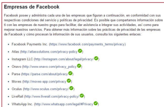
Fig.3 Empresas de Facebook en Facebook, 2015.

“Internet se ha convertido en la Biblia de los publicitarios, que rastrean a los potenciales consumidores por las comunidades online más relevantes, en función del producto que se quiera promocionar, identificando a los líderes de opinión, observando las interacciones de los usuarios (social media monitoring)” (Tello, 2013, pág. 207). En la figura 3, se muestra una lista de las empresas asociadas con Facebook que recopilan información: